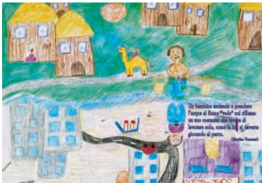
La cartolina realizzata dalle scuole per celebrare la Giornata mondiale dei diritti dei bambini.

Questa amministrazione crede che la cultura sia una parte della politica di welfare importante quanto lo sono il diritto alla salute e l'assistenza sociale. Anche la Costituzione sancisce, fra i compiti fondamentali per lo Stato, quello di difendere, sviluppare e sostenere la cultura ed ogni sua libera espressione ma bisogna dire che il Governo mette a disposizione della cultura ben poche risorse. I cittadini vivono il loro territorio grazie anche all'offerta culturale che ricevono: un territorio pigro di offerte culturali, da poche possibilità di crescita alla comunità che vi vive. Il nostro obiettivo è quello di creare più possibilità di fruizione in campo culturale, conoscendo i nostri limiti sia di natura economica sia di spazi. Cerchiamo di perseguirlo guardandoci attorno, valorizzando le risorse che abbiamo, rappresentate dalla scuola, dalle associazioni del volontariato e dalla biblioteca, con il patrimonio documentale che contiene. La cultura in un piccolo comune come il nostro, nasce dal rapporto con queste realtà, non certo dal cercare di imitare modelli culturali proposti altrove, magari attraverso la televisione. Ci stiamo impegnando per un programma già avviato nell'autunno e che proseguirà per tutto il 2006.