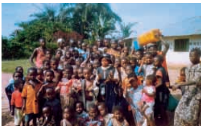
Un saluto dai bambini di Babusongo.