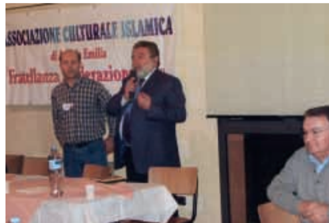
Un momento della festa.

Domenica 20 novembre presso il centro sociale Ca' Rossa di Anzola si è tenuta la festa della chiusura del mese sacro del Ramadan. All'evento erano presenti tutta la comunità musulmana anzolese, il sindaco Ropa, il maresciallo dei carabinieri e altre personalità del paese. La festa, organizzata dalla Associazione culturale islamica di Anzola dell'Emilia, si è svolta in un piacevole clima di amicizia e convivenza che dimostra un'altra volta l'impegno dell'amministrazione comunale all'integrazione di tutti gli immigrati residenti nel territorio comunale. Assadakah augura a tutti i lettori di Anzola Notizie, un sincero augurio di Buone Feste.