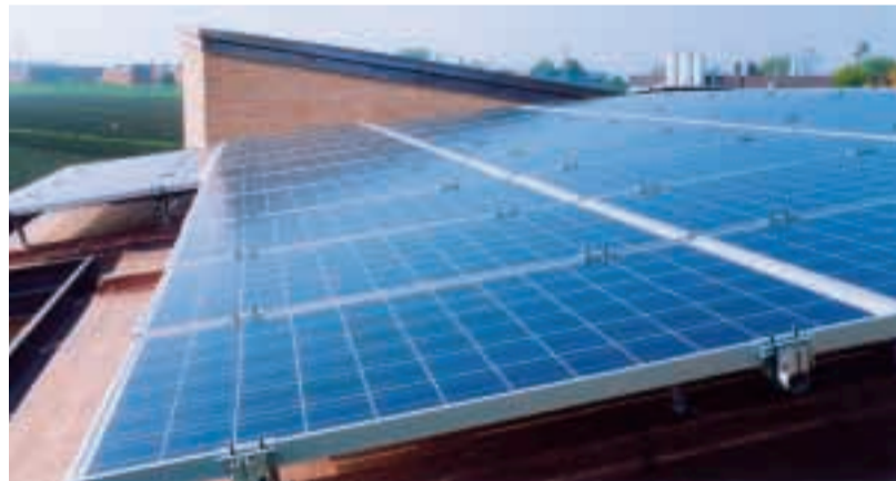
L'impianto fotovoltaico sul nido "G. Rodari".

Arrivano 0,8 MW di fotovoltaico in conto energia in undici comuni. Intanto la nuova tecnologia è funzionante già in due scuole del nostro comune.