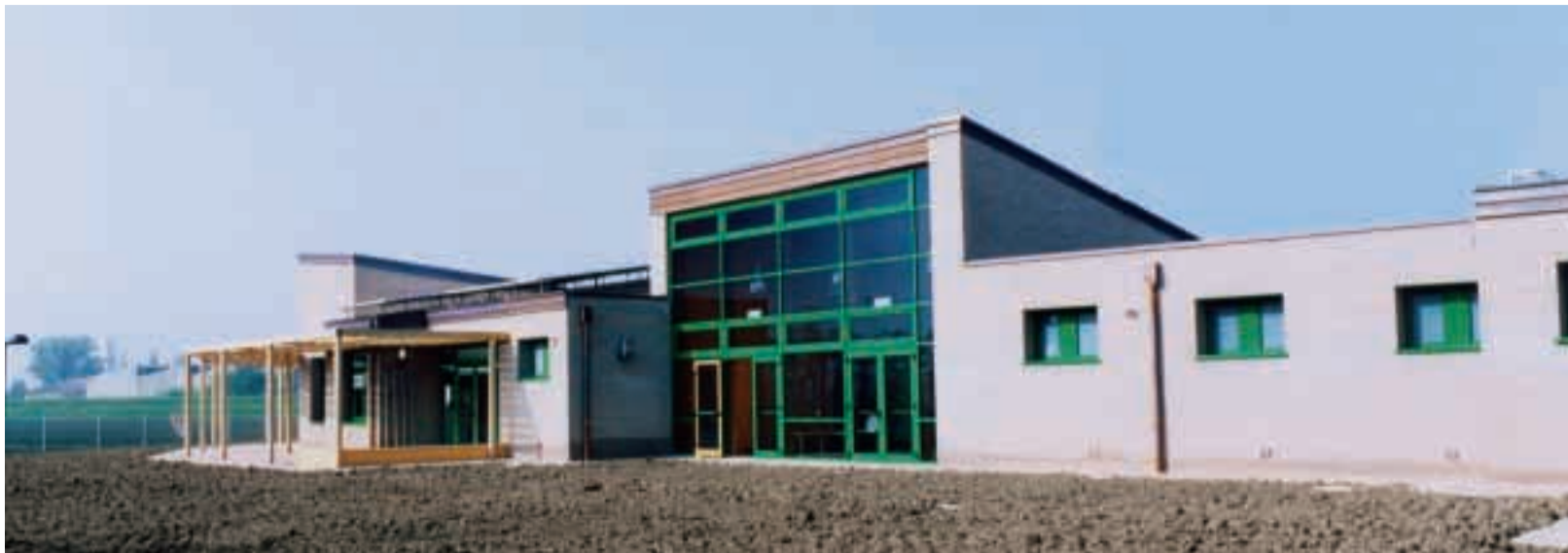
Nido d'infanzia Gianni Rodari in via Risorgimento 20.