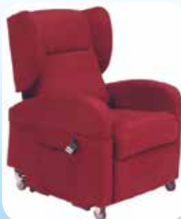
Poltrona Elettrica Elevabile