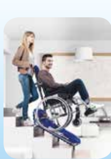
Montascale a Cingoli