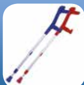
Stampelle e Bastoni

Via Emilia, 39/M LAVINO DI MEZZO 40011 ANZOLA EMILIA (BO) Tel. 051-733810 Fax 051-731367 www.palmirani.com info@palmirani.com