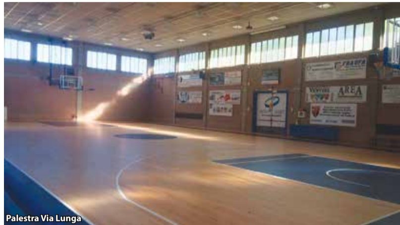
Palestra Via Lunga

Nonostante le scarse risorse disponibili in bilancio, in queste ultime settimane si stanno concludendo alcuni importanti lavori pubblici ed altri di minore entità, ma sempre utili alla nostra comunità. Ecco un quadro sintetico: