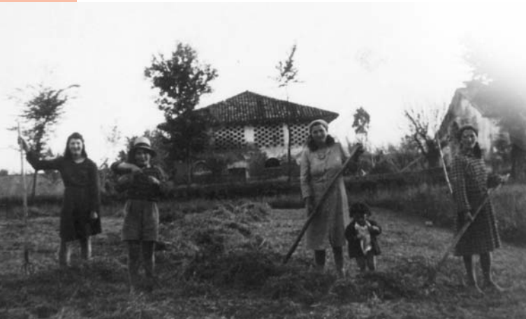
Nell'immagine, Base partigiana

Sarà presente il regista Carlo Lizzani , testimone degli anni del Neorealismo e grande interprete del movimento.